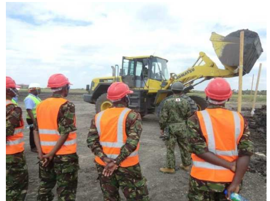
2016 - Formation à l'utilisation d'un tractopelle